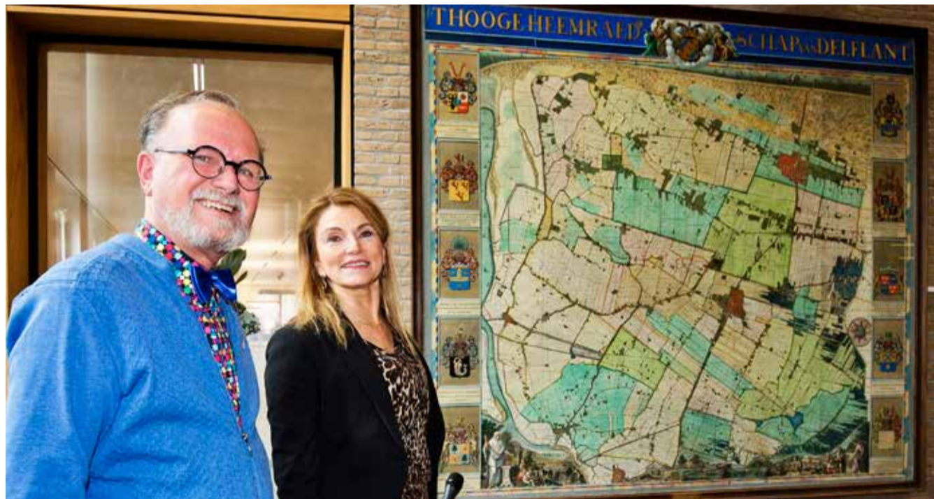
Foto: HH Delfland onthult Kruikiuskaart

Onlangs is door het algemeen bestuur van Delfland de Watervisie voor de regio vastgesteld. Het cultuurhistorisch erfgoed is één van de dragers voor de realisatie van de watervraagstukken. De inbreng van bewoners met betrekking tot de geschiedenis van de streek is een niet onbelangrijk aspect voor de oplossing van watervraagstukken. Het grootste karwei moet nog plaatsvinden. We moeten het poldermozaïek van Delfland niet alleen conserveren maar ook consumeren. Erop of eronder, cultureel watererfgoed is de spil voor waterstaatszorg.