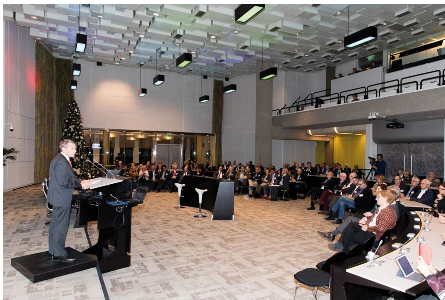
Prof. mr. J.P.H. Donner aan het woord tijdens Statenontmoeting met raadsleden