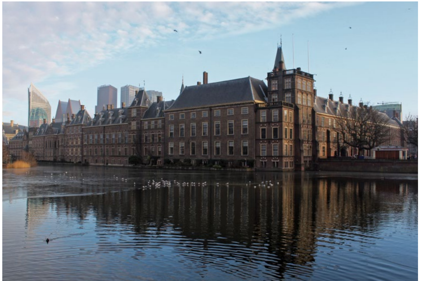
Hofvijver met gebouwen van het Binnenhof (zie pagina 4)